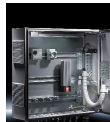
幅広い使用用途に対応