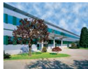
ミラノ ノバーテ工場

イルメの技術を日本にご提供するため、1998 年に設立しました。 専任のエンジニアによる最適商品の選定・技術サポート、 約 1,000 種類 200 万個以上の国内在庫により、柔軟な納期対応を行っております。