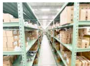
<1つから購入可能な常備在庫品>