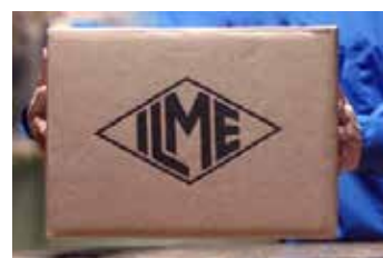
<ひとつひとつ丁寧に>

このスター型生産体制は、穴あけ加工や塗装など、中間品の後工程を変更することでバリエーションが多い角型コネクタの生産数量の調整が可能になり、約1年分確保した原材料と合わせて、安定した商品供給を実現します。